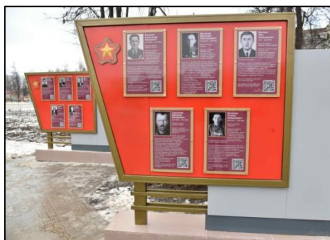
Стенд с информацией о полных кавалерах ордена Славы в Парке Победы (Йошкар-Ола)